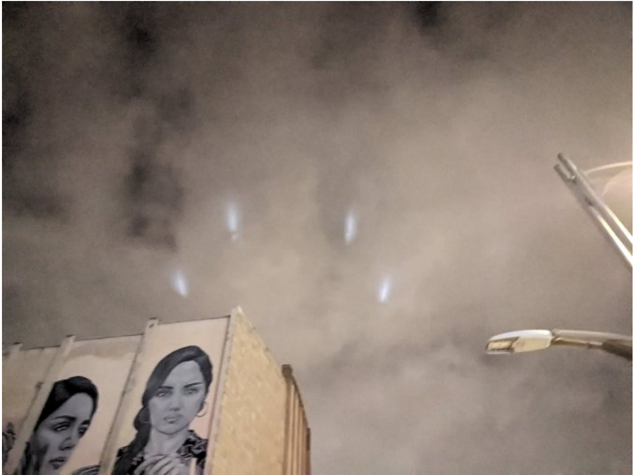
Fotograma tomado del video de dominio público de la red social del canal @diariodelcid